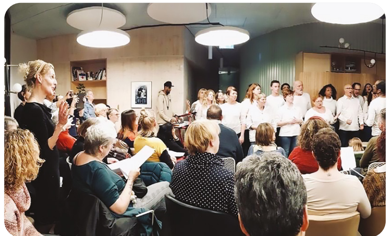
CONCERT DE GOSPEL AU CENTRE OTIUM